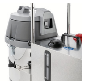
Saugmotor mit hoher Leistung