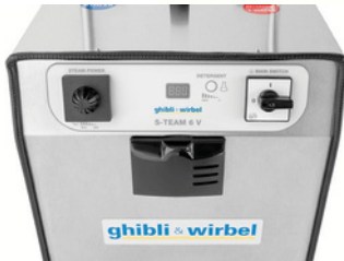
Bedienpult mit Display

Dampf Reiniger mit Absaugung und Desinfektionsmöglichkeit