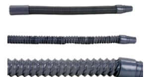
Spezial haste Teleskopschlauch