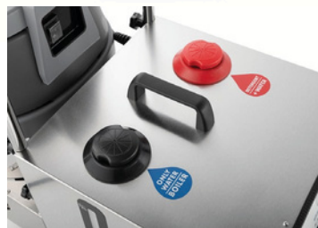
Tanks für Wasser und Reinigungslösung