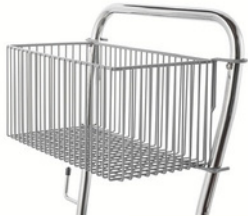
Wagen mit Korhalter für Zubehör