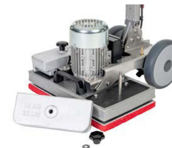
Abnehmbare Gewichte für leichten Transport