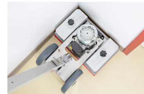
Ideal für randnahe Arbeiten